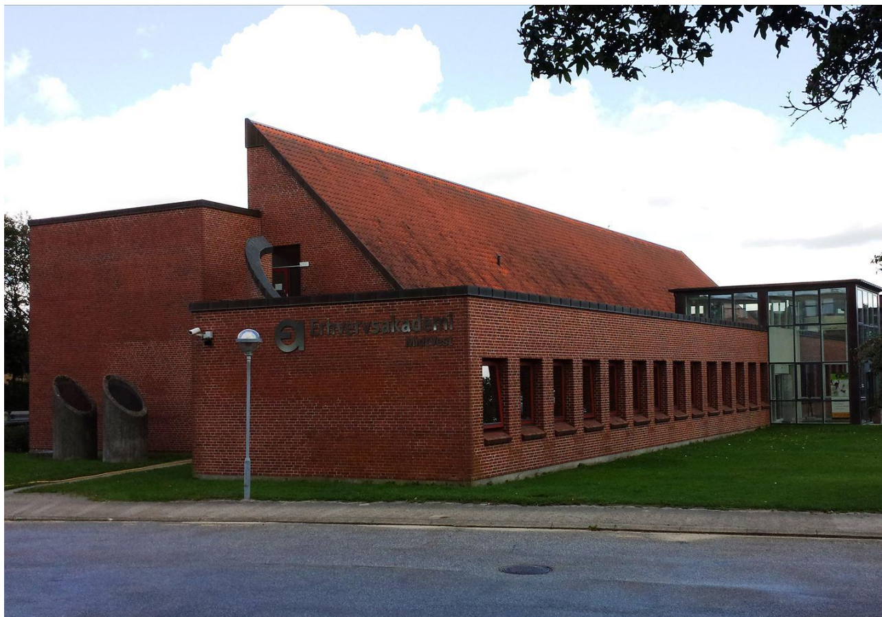
Ejendomsfoto fra 2014

Ifølge BBR er bygningen opført i 1983 og med den foreløbig seneste større ombygning i 2013. Et C-energimærke er meget typisk for bygninger fra tidsperioden (bygninger fra 1979-1998 har typisk energimærke C, D eller E;).